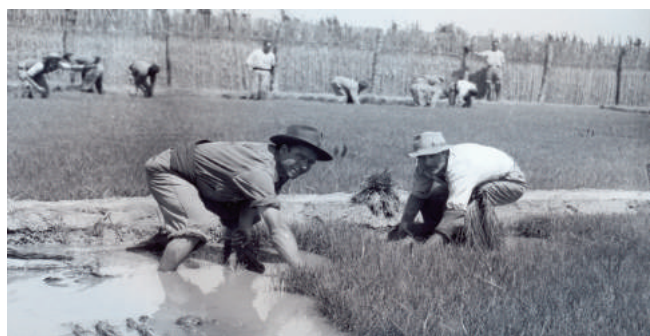
La història dels cultius d'arròs