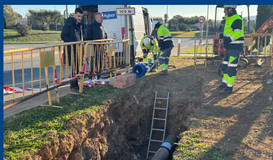
Millora de la xarxa d'aigua