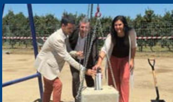
Primera pedra de l'ETAP