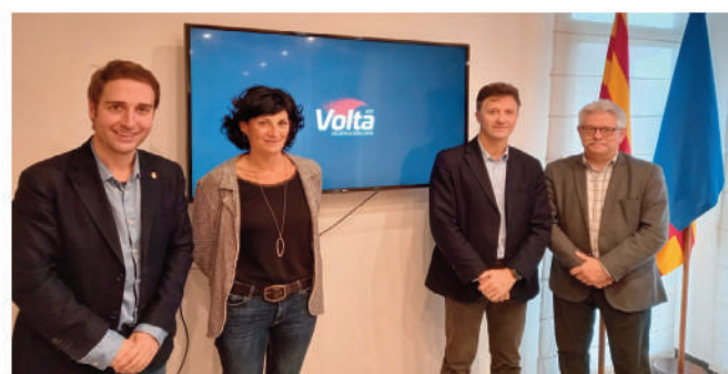
La Volta a Catalunya, a l'Escala