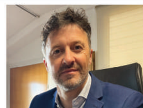
VÍCTOR PUGA Alcalde de l'Escala "Amb les actuacions previstes, l'Escala farà un salt endavant"