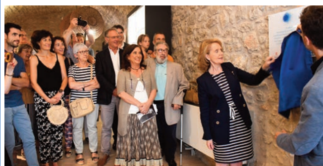
Càtedra i Espais Victor Català