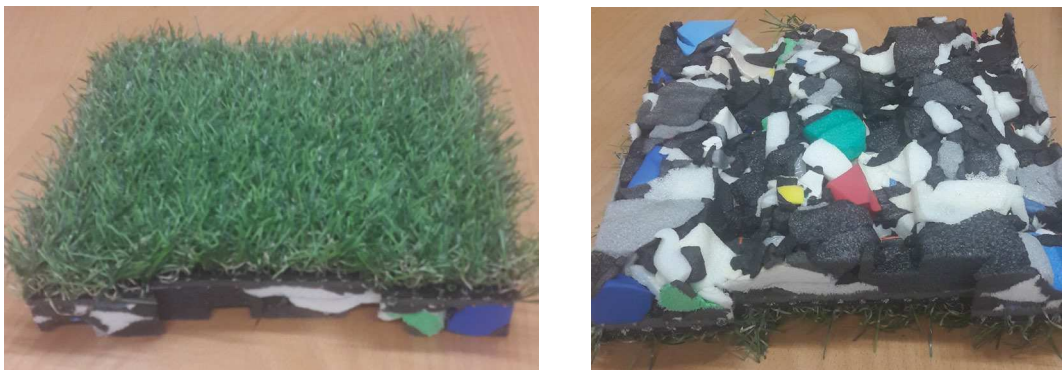
F1. Mostra del paviment existent de gespa artificial

En la zona del turó la base és de formigó i al damunt s'hi ha col·locat directament la gespa artificial. A la part superior del talús es troba un paviment de llosetes de cautxú, actualment endurit i recremat pels efectes del sol.