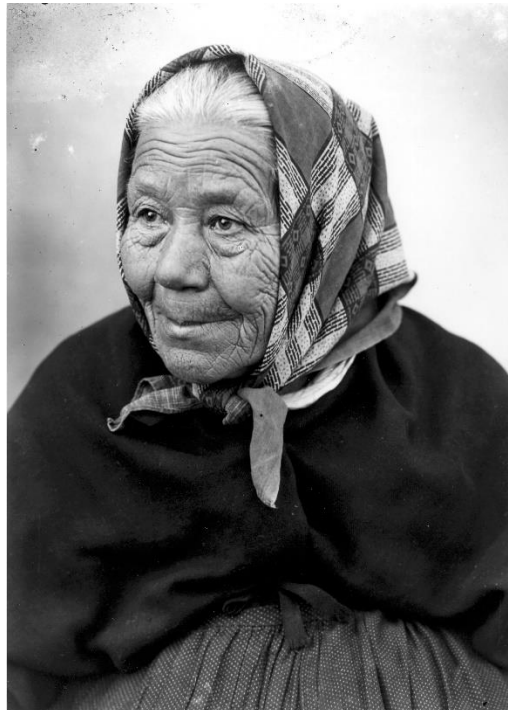
L'Àvia Cisa.