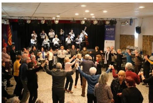
Acte inaugural dels 150 anys del naixement de l'Avi Xaxu. Fotografia feta per Basili Gironés i Bofill.

Correu electrònic: agrupacionsardanistaavixaxu@gmail.com