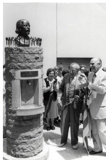
Foto de l'Aplec de l'any 1981. Inauguració del monument a l'Avi Xaxu.

Propostes a Canal 10 TV l'Escala per als més menuts, hi trobareu contes, titelles i manualitats. http://www.canal10.cat/programa/pels-ms-menuts